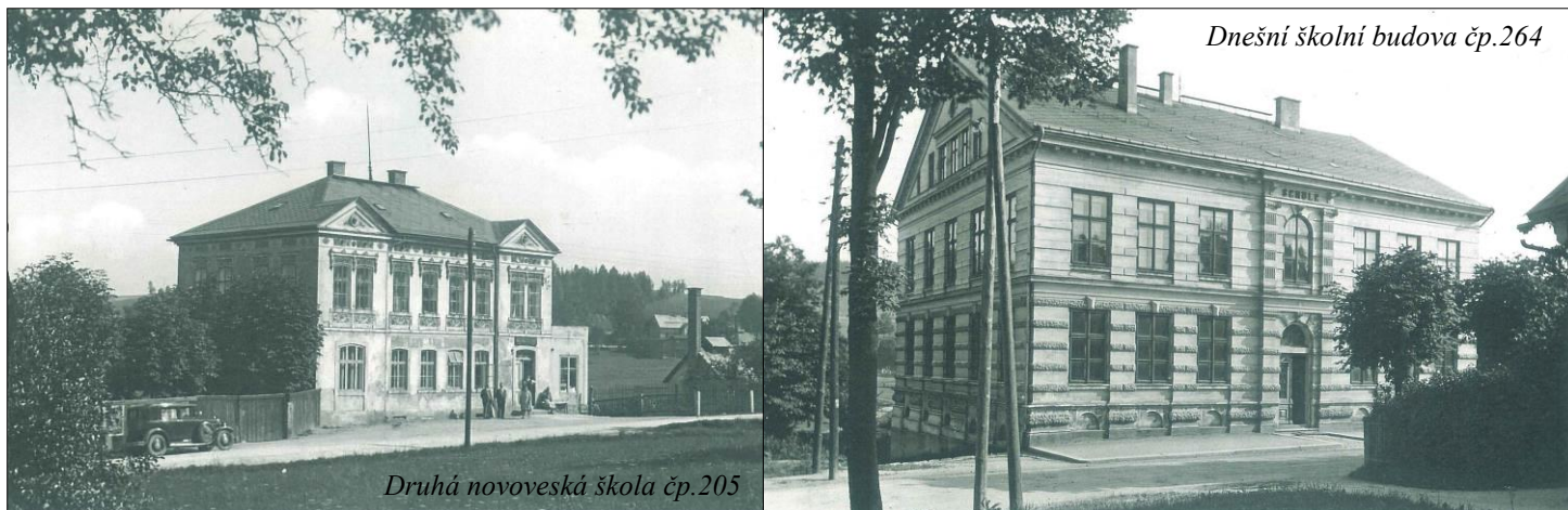
Druhá novoveská škola čp.205

V roce 1872 koupila obec dům Franze Kleinerta (bratra zakladatele novoveské huti) čp.205 (dnes čp.583 – budova bývalého rekreačního zařízení Vesna II) a zřídila v něm školu. Současně převzal vedení školy Robert Weisshaupt. V roce 1875 byla otevřena třetí třída, avšak již v roce 1886 učební místnosti kvůli nadměrnému počtu žáků opět nedostačují.