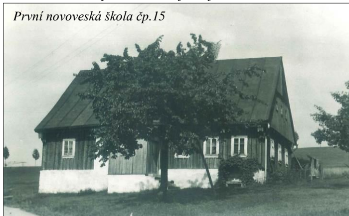
První novoveská škola čp.15

Kvalitu výuky zprvu předurčovala osoba učitele, který v prvopočátku často neměl pedagogické vzdělání, spíše životní zkušenosti. Děti se učily číst, psát, počítat, výrazná při vzdělávání byla role církve a výuka náboženství. Učitelé vcelku neúspěšně bojovali s absencí žáků, kteří byli svými rodiči zaměstnáváni, či posíláni na přivýdělek.